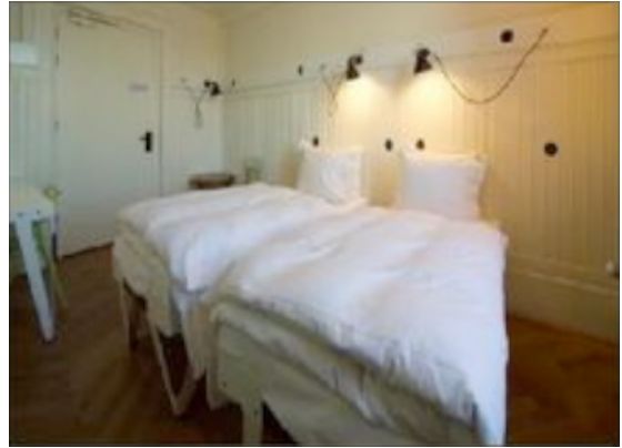
Kamer met wandsysteem van Christoph Seyferth