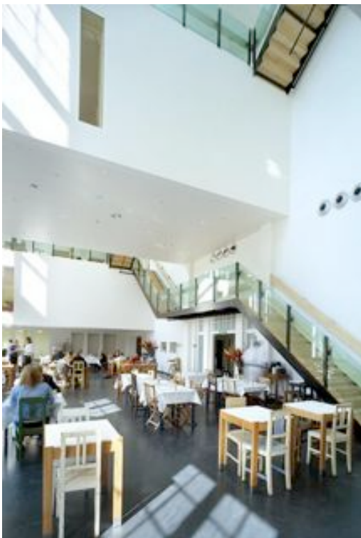
Restaurant met vide

Binnen is vooral de vide tot aan het dak spectaculair licht en ruimtelijk. Jammer dat de status van rijksmonument ingrepen in de gevel onmogelijk maakte. De gehandhaafde interne hoofdstructuur blijkt te rigide voor de functie van hotel met restaurant en belemmert de buurtfunctie. Als gevangeniscel voldeden de bestaande kantoorruimtes misschien prima, maar voor hotelkamers zijn ze te klein om nog comfortabel te zijn. Interessanter zijn de kamers op de nieuwe vloeren door hun originele vormgeving en atypische inrichting (zoek de badkamer). De ingang ontmoedigt spontaan binnenlopen. Pas voorbij een van de twee smalle doorgangen langs de receptie kun je een blik in het restaurant werpen. Van buiten oogt het niet gastvrij en naar binnen gaan voelt evenmin vrijblijvend. Dat kunnen ook de activiteiten van de Culturele Ambassade niet verhelpen. Deze trekken een specifieke doelgroep aan via aankondigingen in de krant of op internet en zijn niet direct gericht op de buurt.