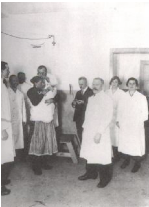
Nieuw-gearriveerden worden ontluisd en ontsmet