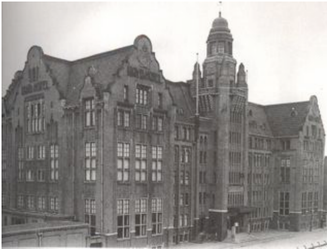
Oude Lloyd Hotel, Amsterdam. Noord- en oostgevel

De Rietlanden ligt in het hart van het Amsterdamse Oostelijk Havengebied en vormt de schakel tussen de Oostelijke eilanden en het stadscentrum. Toen dit gebied werd getransformeerd tot nieuw woon-werkgebied, stonden er nog enkele gebouwen uit de periode waarin de haven volop in bedrijf was. Deze werden ingezet om het nieuwe gebied identiteit te geven. Het opvallendste nog resterende gebouw was het Lloyd Hotel, van architect Evert Breman (1859-1926). Een streng, robuust gebouw in een samenspel van stijlen. Misschien geen 'hoogstaande architectuur', maar wel kenmerkend voor een bepaalde periode in het begin van de twintigste eeuw.