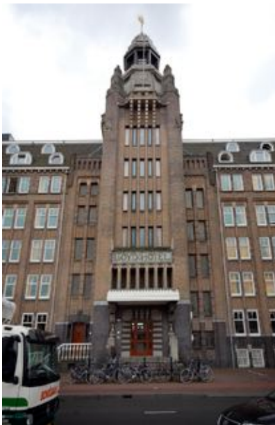
Vernieuwde Lloyd. Entree