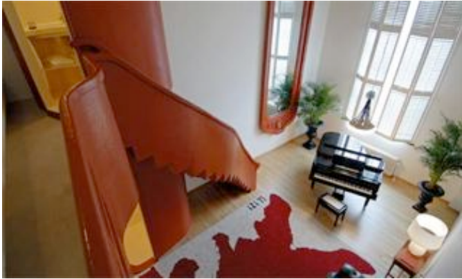
Klassieke muziekkamer Atelier Van Lieshout

in dit gebouw een onlosmakelijke eenheid, met evenveel monumentale waarde. Het had dan, bijvoorbeeld als dependance van het Scheepvaartmuseum, kunnen getuigen van een minder glorieus stuk scheepvaartgeschiedenis.