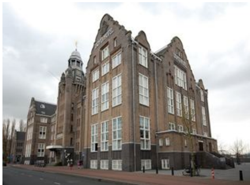
Noord- en westgevel

Het lastigst bleek om het afstandelijke, rigide gebouw te transformeren tot een open en gastvrij hotel zonder iets aan de gevel te veranderen. Voormalige bewoners van het Lloyd Hotel typeerden het als luguber, claustrofobisch, vijandig. Nu waren dat gevangenen of anti-kraak kunstenaars, maar recente opmerkingen van hotelgasten als "The hotel from the outside looks like a mental hospital" en "Unfortunately, the prison atmosphere is still maintained in the quality of both the rooms and the staff" bevestigen dat het Spartaanse karakter van het gebouw dwars door het design heen nog tastbaar aanwezig is.(4) Nathalie de Vries, van MVRDV, vond het gebouw de eerste keer dat ze er kwam 'angstaanjagend' en vroeg zich