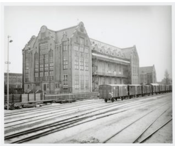
West- en zuidgevel

Het Lloyd Hotel opende in 1921 zijn deuren als landverhuizershotel voor arme tussendekspassagiers van de Koninklijke Hollandsche Lloyd. Toen deze firma in 1936 failliet ging, kwam het Lloyd Hotel in handen van de gemeente, die het eerst voor het onderbrengen van Joodse vluchtelingen gebruikte en vanaf 1941 als gevangenis. In 1965 werd het een van de zwaarst bewaakte jeugdgevangenissen van Nederland. Door de geïsoleerde ligging tussen het water en de sporen was ontsnappen een hachelijke onderneming. Tussen 1990 en 2003 was het een kunstenaarskolonie. De kunstenaars braken de wanden weg om licht terug het gebouw binnen te brengen. In al die tijd was de staat van het Lloyd hotel behoorlijk achteruitgegaan en er bleef een lugubere sfeer hangen.