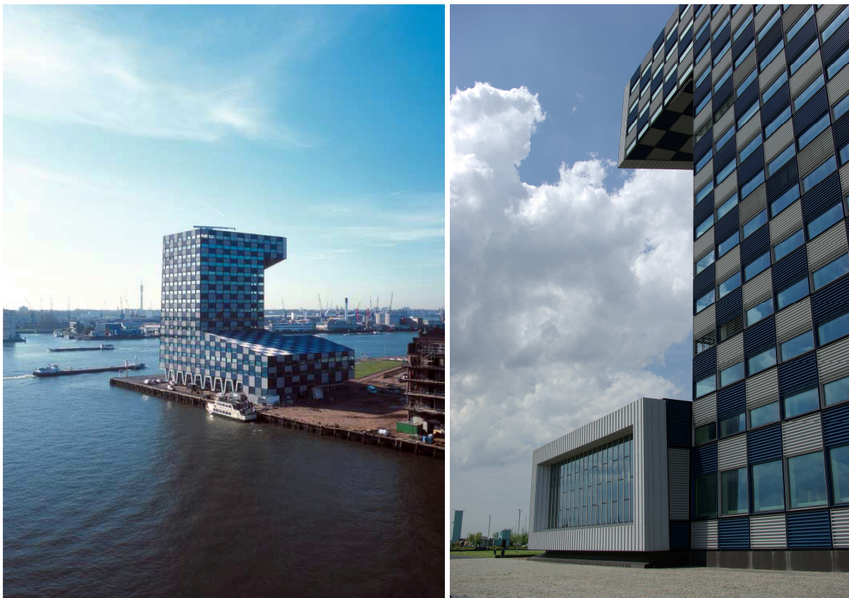
Het Scheepvaart- en transportcollege op de Lloydpier in Rotterdam, Neutelings Riedijk.

Dit is het nieuwe Scheepvaart en Transport College (STC), een verzamelgebouw waarin drie scholen gehuisvest worden, bij elkaar goed voor ongeveer 2000 leerlingen. De drie scholen zijn simpelweg op elkaar gestapeld, onderin het VMBO, in het midden het HBO en boven de opleidingen voor de beroepswereld. Het centrale, open roltrappenhuis creëert een levendige ruimtelijke verbinding tussen de drie scholen en geeft een fijne dynamiek aan het interieur van het gebouw. De consistent samengestelde plattegronden zijn coherent opgebouwd; aan de oost- en westzijde lokalen, aan de noord- en zuidzijde de docentenkamers en centraal een blok met hierin de duidelijk herkenbare servicezone en verkeersruimten. De uitstulpingen van het 70 meter hoge, 14 verdiepingen tellend torengedouw zijn gevuld met afwijkende, vaak collectieve, programmaonderdelen. In de plint van het gebouw vindt men een café en een winkel, de leerlingenkantine, de personeelskantine, werkplaatsen, een gymzaal en een aantal fascinerende vaarsimulatoren. Boven in de markante kop van het gebouw, in een 20 meter lange overkraging, hangt een grote collegezaal boven de Maas, met een fraai uitzicht over de Rotterdamse haven. De interne structuur, de motor van het gebouw, loopt als een goed geoliede machine.