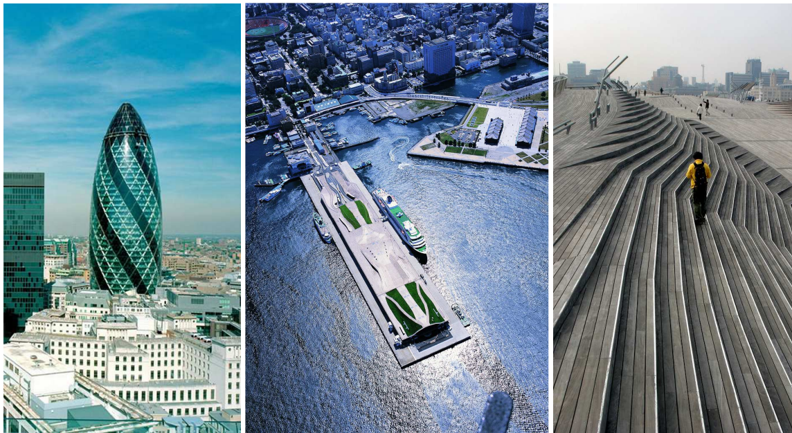
links: Swiss Re toren van Norman Foster in Londen, midden en rechts: de Yokohama Cruise Terminal van FOA

Alejandro Zaera-Polo van Foreign Office Architects pleit voor een meer rechtschapen en bescheiden benadering van het gebouw als icoon. Het gaat om de waarheid in de belichaming van een gebouw, een gevel mag niet zomaar een beeld vormen, maar presenteert eerlijk de constructieve en functionele organisatie van het gebouw. In de Yokohama Cruise Terminal van Foreign Office Architects wordt de beeldspraak van de Japanse tsunami, door kunstenaar Hokusai verbeeld in "The great wave off Kanagawa", toegepast om de constructie vorm te geven en de verschillende passagierstromen door het gebouw te leiden. Er ontstaat een dubbele agenda in de verbeelding van de boodschap, een gelaagdheid in het gebouw die een duurzame betekenis genereert. 5