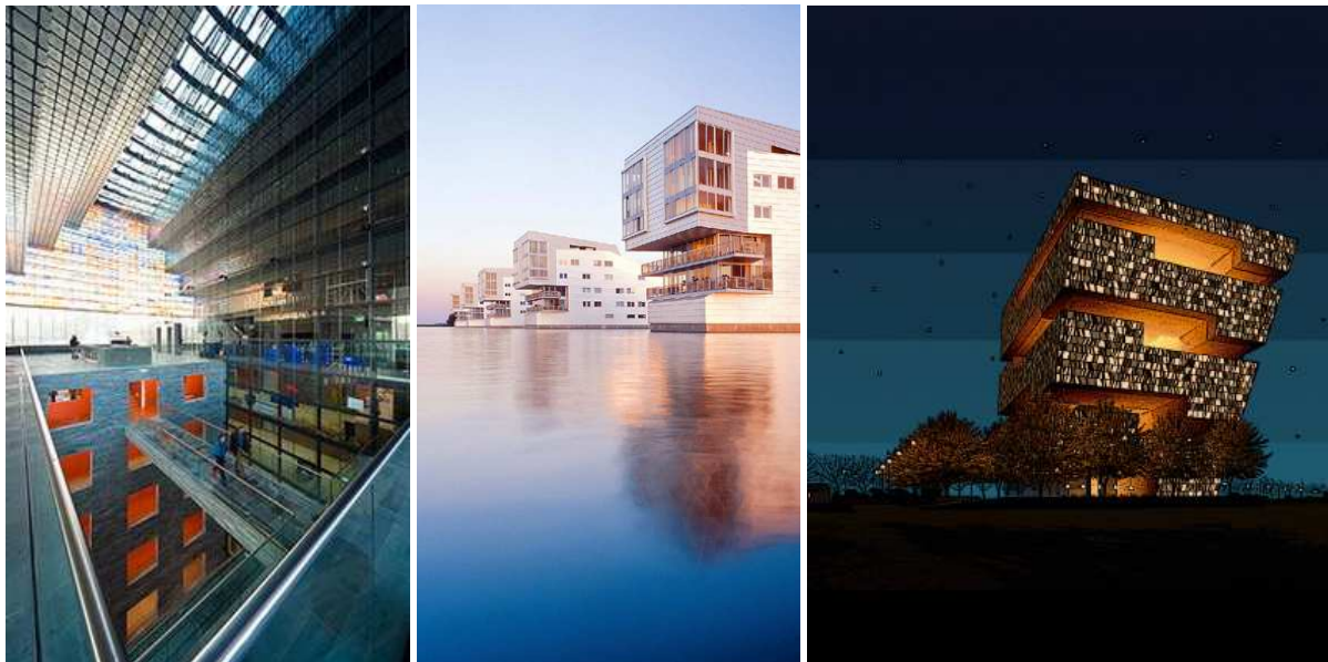
werken van Neutelings Riedijk: v.l.n.r. Mediacentrum in Hilversum, Sphinxen in Huizen en de bibliotheek in Praag

Blijft de vraag of het STC een icoon is of niet? In de zoektocht naar de definitie naar de iconische status van dit ontwerp, zijn er veel gelijkenissen te zien met Charles Jencks' enigmatic signifier . Het is een gebouw met een sterke evocatieve kracht, zonder dat de symbolische strekking onmiddellijk duidelijk wordt. Pas na een tijd in en rond het gebouw te verblijven, wordt de omstander gewaar van de symboliek die het gebouw in zich heeft. Uiteindelijk zal de ware iconische waarde van dit gebouw, en dat geldt ook voor architectuur in het algemeen, gedefinieerd worden door de mate waarmee het publiek het gebouw in de armen zal sluiten als toonbeeld voor de Rotterdamse haven.