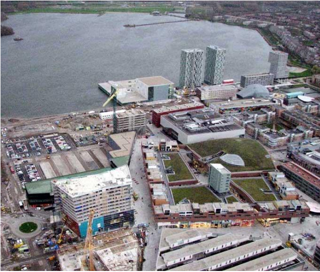
overzicht 'Stadshart Almere', midden 2007

O.M.A.'s aanpak is dus gebaseerd op revolte in plaats van integratie. De basis van het ontwerp is een sabotage van het Broadacremodel dat Almere, met zijn lage bebouwing in een natuurlijke omgeving, typeert. Koolhaas wil dit bereiken door net dat te doen wat tegengesteld is aan de 'geest' van Almere. Hij breekt gewild met het generieke bestaande door de introductie van het specifieke nieuwe. Een uitgangspunt dat trouwens volmondig door de gemeente werd onderschreven met de idee van 'jonge monumenten' : In het zog van Koolhaas werden onder meer SANAA, Claus en Kaan, Christian de Portzamparc, Chipperfield, Alsop, etc. uitgenodigd om één van de blokken uit het O.M.A.-masterplan te verwezenlijken. Elk van deze architecten werd gevraagd om de eigen creativiteit de vrije loop te laten om zo tot een showcase van hedendaags bouwen te komen.