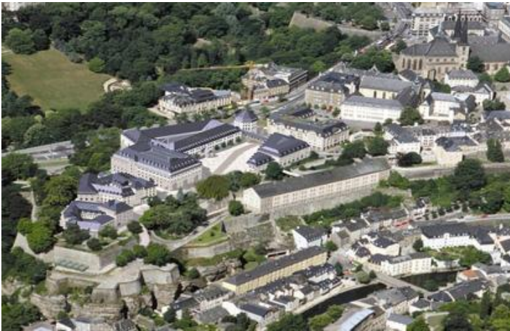
overzicht 'Cité Juridiciaire', afgewerkt 2008

Kriers 'Cité Juridiciaire' ('het gerechtelijk stadsdeel') is een verwoede poging om instant erfgoed te creëren. Het programma, een gerechtsgebouw, werd opgedeeld in meerdere bouwblokken die een stedelijke eenheid, refererend aan het bestaande weefsel moesten opleveren. Gelegen op een berg die gedeeltelijk gecatalogiseerd staat als UNESCO werelderfgoed, maakt Krier een publieke ruimte op mensenmaat, gevormd door bouwvolumes. In tegenstelling tot Koolhaas is provocatie hier taboe en verglijdt hij bewust in een citatenarchitectuur. Hij wil het nieuwe integreren en doen opgaan in het bestaande.