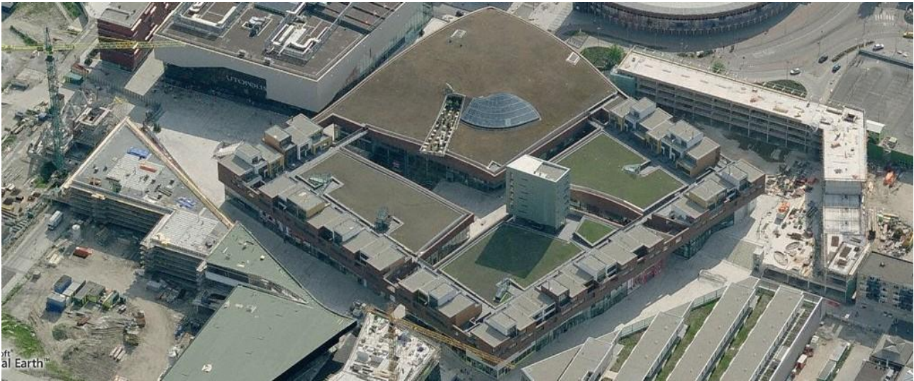
Loopbruggen, uitkijkoren, kantelen in blok 6 van 'Stadshart Almere'

boven winkels, met huizenvolumes die als kantelen de bovenrand vormen van het blok. Voeg daarbij het geplooid maaiveld dat dienende en bediende programma's scheidt en op de hele site voor voortdurende perspectiefveranderingen zorgt. Het lijkt dat Koolhaas hier onbedoeld zijn eigen theorie van het generieke neersabelt. 'Stadshart Almere' lijkt daarmee een vingeroefening Krier of Sitte waardig : Beiden Retropolis van een concurrerende ideologie.