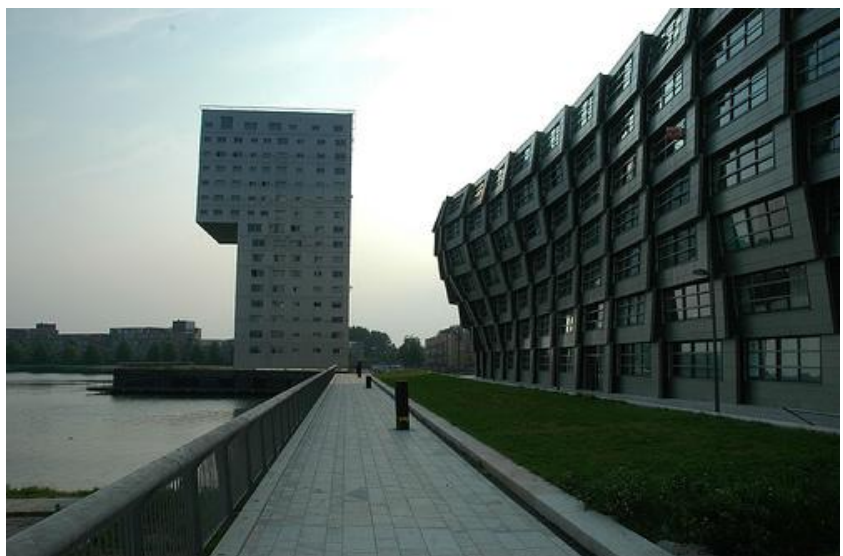
Drie sculpturen in het nieuwe hart van Almere